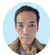
山三・山五地区 大川 穂高