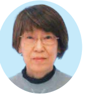
岸部地区 海貝 博美