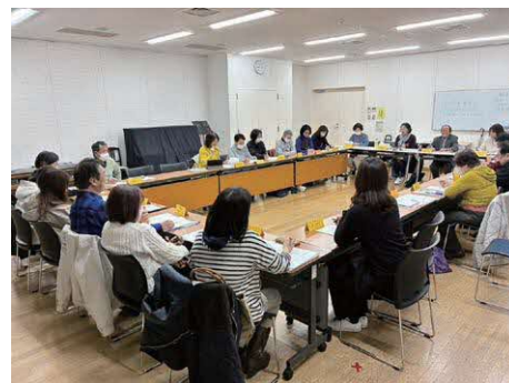
月一回の定例会の様子